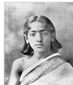
J. Krishnamurti (12 Mayo de 1895-17 de Febrero de 1986)

En esta ocasión analizaremos la Alegría.