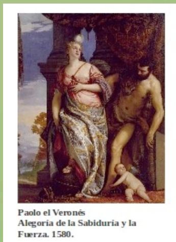
Paolo el Veronés Alegoría de la Sabiduría y la Fuerza. 1580.

"Diario de El Puente a la Libertad Pablo El Veneciano". Discurso del Amado Maestro Ascendido Pablo El Veneciano. Serapis Bey Editores S.A. Panamá.